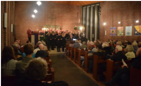
Chorkonzert im Advent