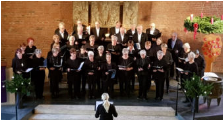
Gemischter Chor Oeversee