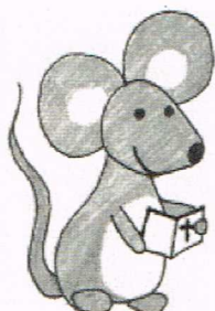
Kiki die Kirchenmaus

Bitte melden Sie sich (und Ihre Begleitperson) an unter der Nummer des Gemeindebüros 04639-342